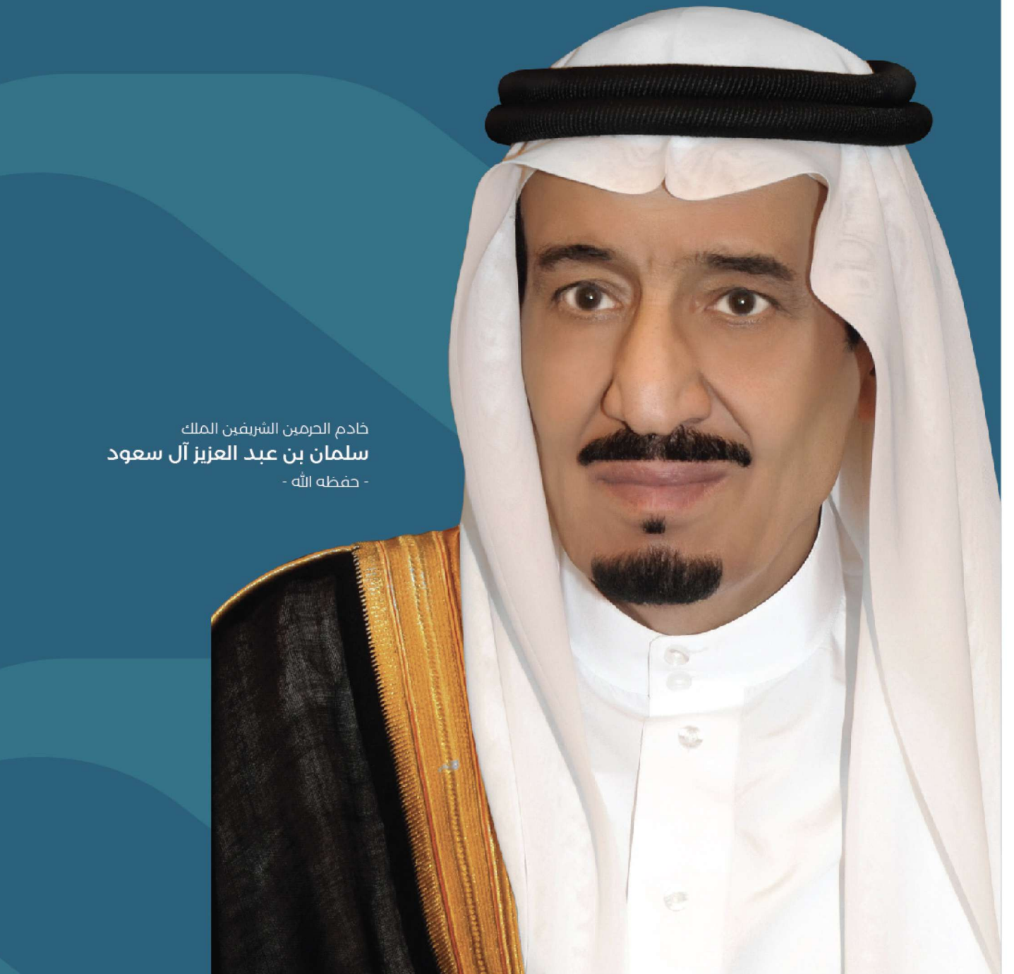
خادم الحرمين الشريفين الملك سلمان بن عبد العزيز آل سعود - حفظه الله -

إن توفير السكن الملائم للمواطنين وأسباب الحياة الكريمة من أولوياتنا، وهو محل اهتمامي الشخصي، وما صدر مؤخراً من تنظيمات وقرارات يصب - بمشيئة الله - في هذا الاتجاه، فالجميع يدرك ما توليه الدولة من رعاية واهتمام بهذا القطاع، وما اعتمدت له من ميزانيات ضخمة.