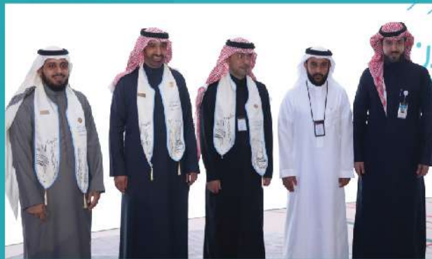
تكريم معالي وزير الموارد البشرية والتنمية الاجتماعية منصة جود الإسكان تقديراً لجهودها في تحفيز العطاء السكني.