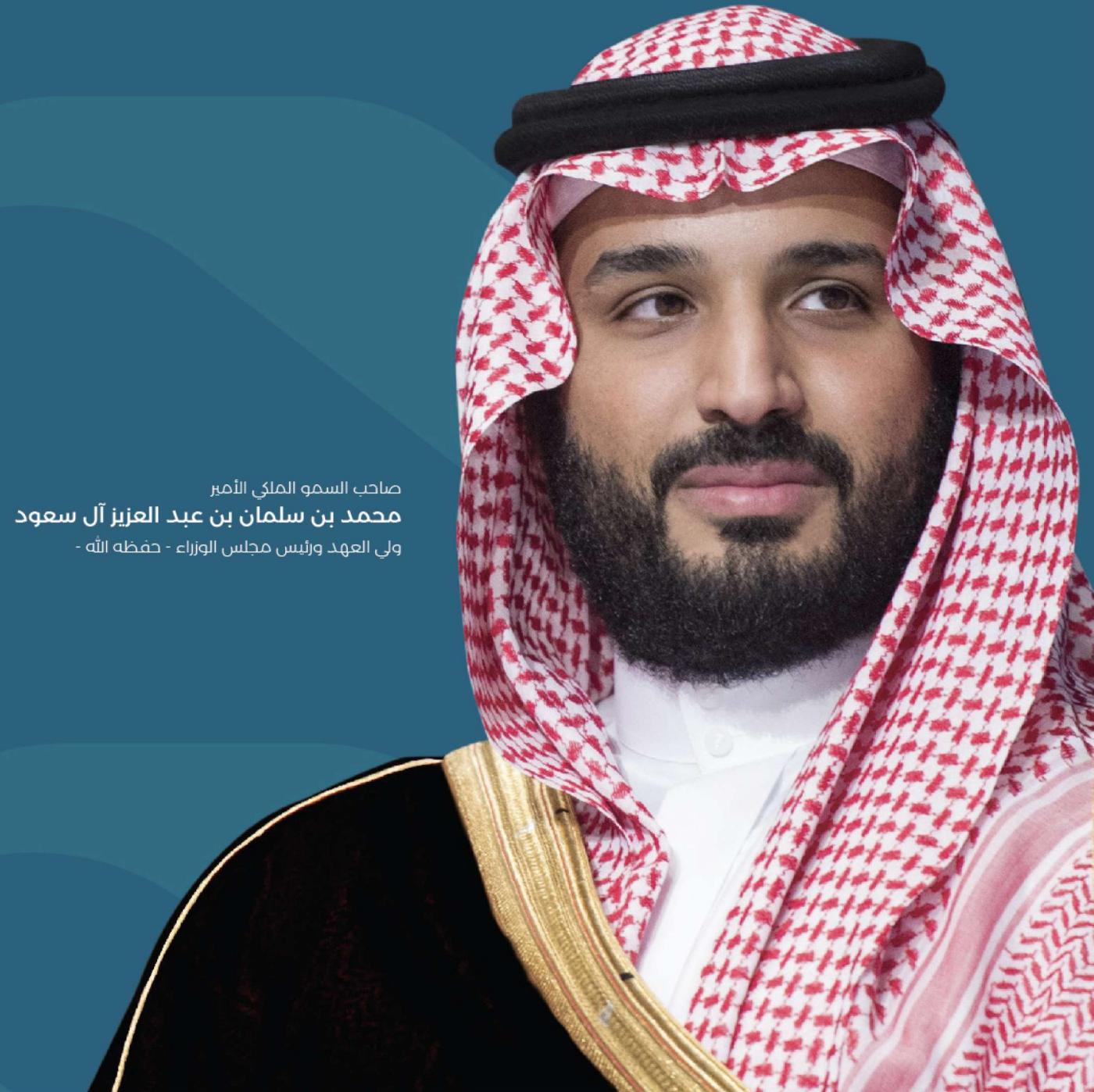
صاحب السمو الملكي الأمير محمد بن سلمان بن عبد العزيز آل سعود ولي العهد ورئيس مجلس الوزراء - حفظه الله -

سنكون أحد أعلى دول العالم في نسبة تملك المساكن.