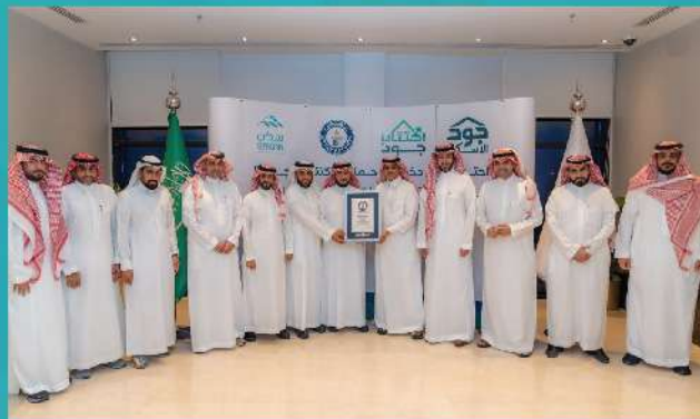
حصول حملة إكتتاب جود على شهادة غينيس للأرقام القياسية كأكبر حملة تبرعات خيرية إلكترونية خلال شهر رمضان 1444هـ.